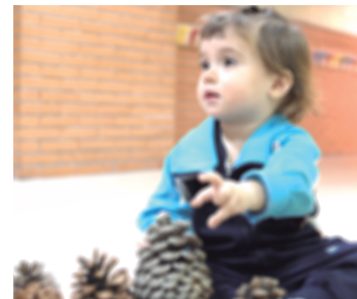
Legitimación para el tratamiento de sus datos

DESEO QUE MI HIJA/O SEA FOTOGRAFIADA Y GRABADA PARA LAS FINALIDADES DESCRITAS