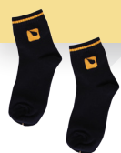
#10 Caletín corto