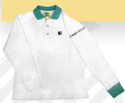
#04 Polo manga larga