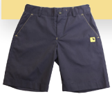
#06 Pantalón corto