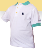
#03 Polo manga corta